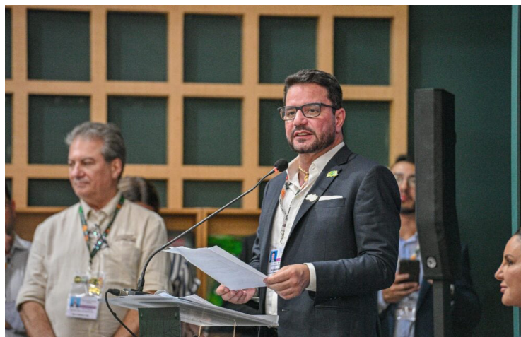
Governador afirma que o Acre é referência em preservação ambiental.

“O Acre reafirma seu protagonismo na agenda ambiental ao adotar um instrumento moderno e transparente para direcionar investimentos sustentáveis. O Orçamento Climático vai garantir que cada ação do governo seja pensada também sob a ótica do impacto ambiental e social”, destaca o governador.