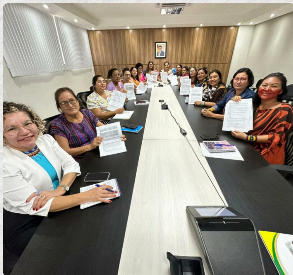
REPRESENTANTES DAS CINCO REGIONAIS DO ACRE ELABORAM REGIMENTO INTERNO DA CÂMARA TEMÁTICA DE MULHERES DO SISA