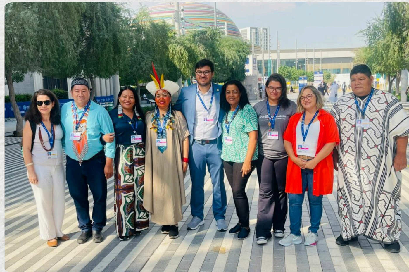
PARTICIPAÇÃO SOCIAL DE LIDERANÇAS DO ACRE MARCAM A COP28 EM DUBAI