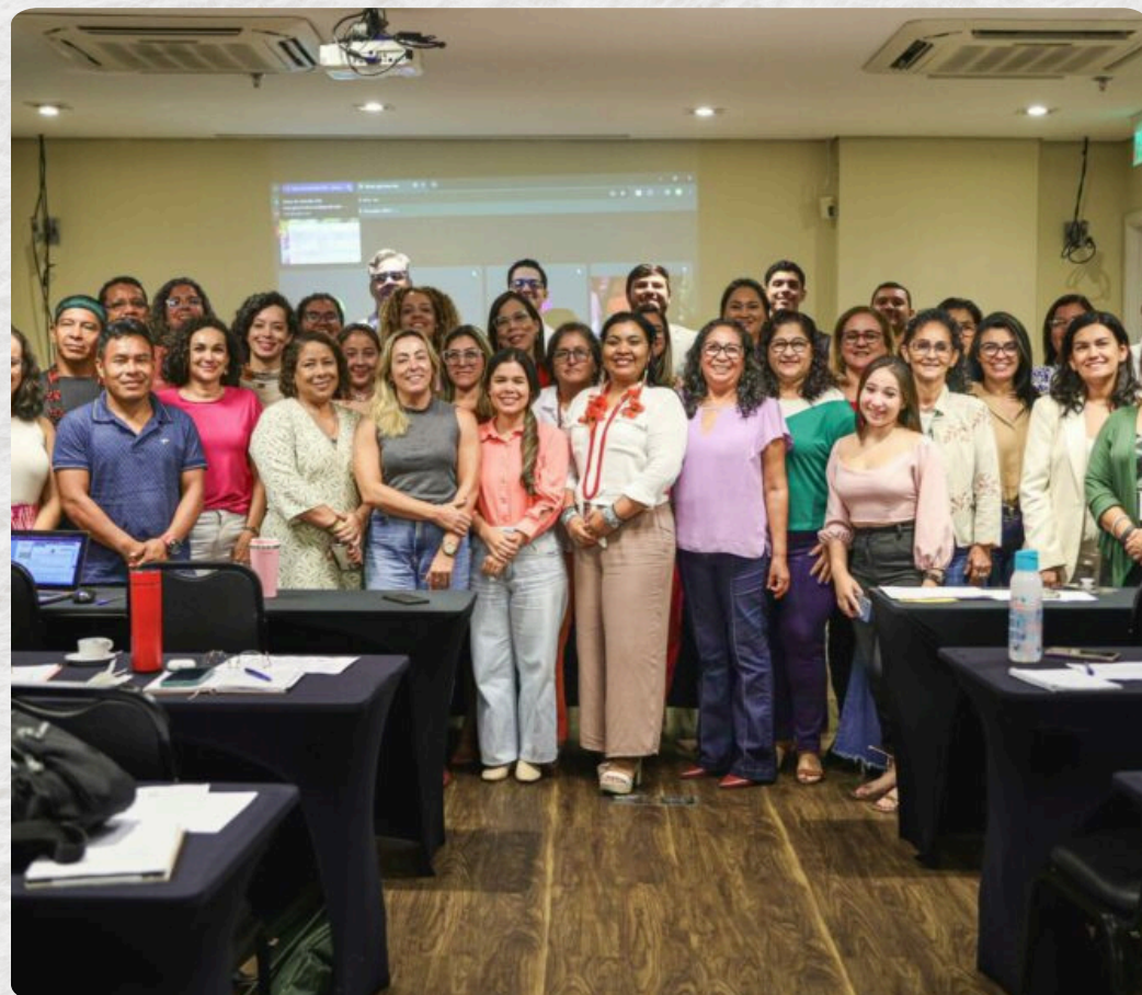
OFICINA DE SALVAGUARDAS SOCIOAMBIENTAIS DO SISA