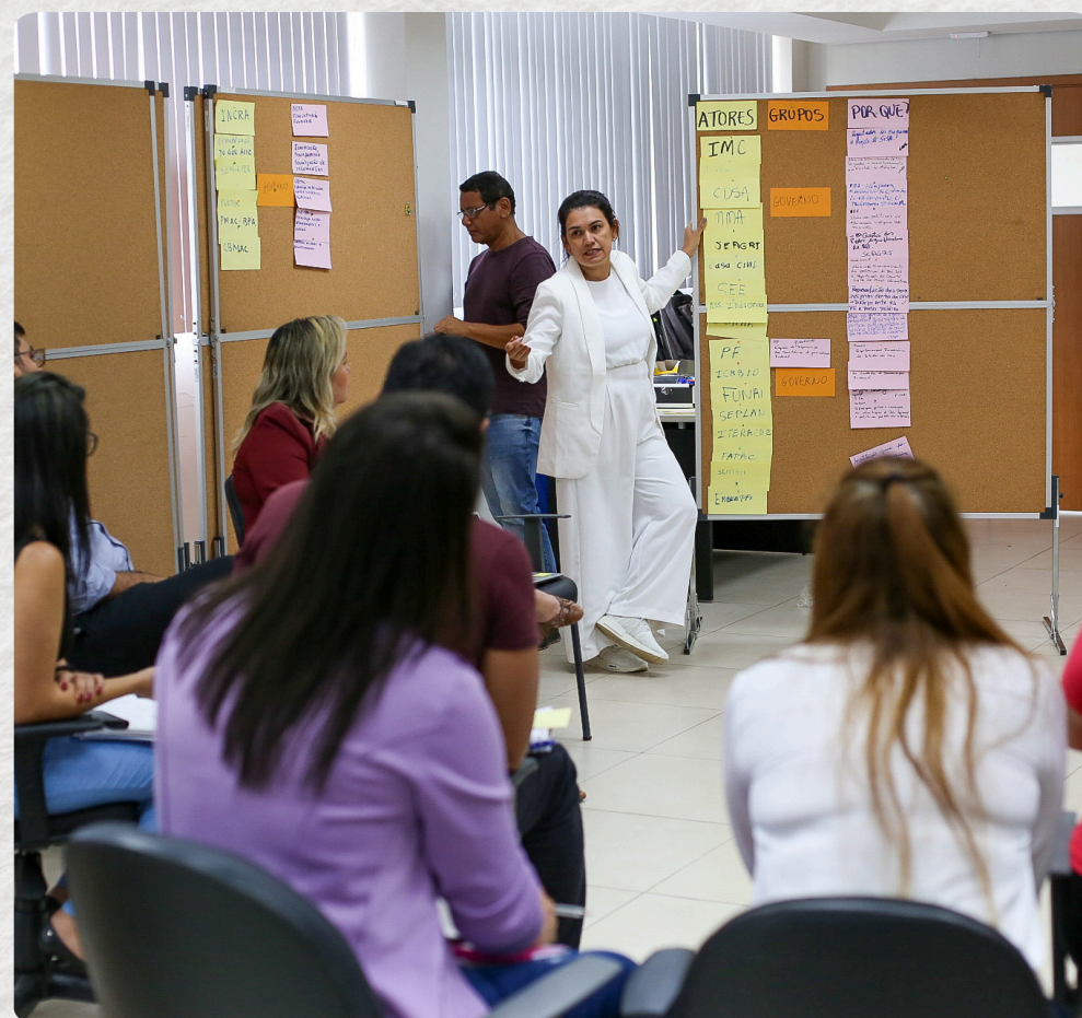
PLANEJAMENTO PARA ATUALIZAÇÃO DAS SALVAGUARDAS SOCIOAMBIENTAIS