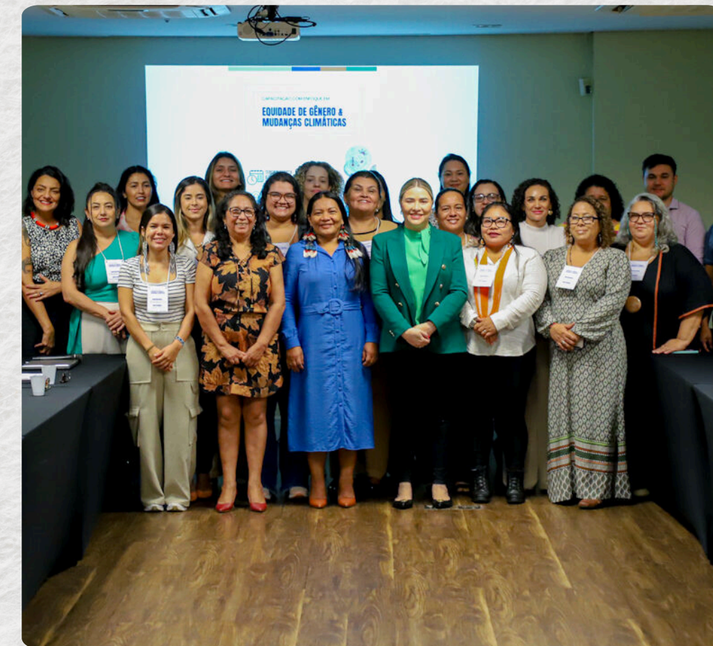
CAPACITAÇÃO EM EQUIDADE DE GÊNERO E MUDANÇAS CLIMÁTICAS