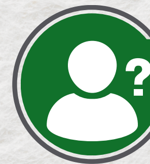
Xxxx X xx