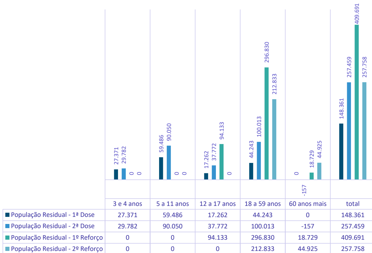
Gráfico 2. Análise de população residual para recebimento de 1ª, 2ª dose, 1º Reforço e 2º Reforço, segundo grupo de faixa etária, Estado do Acre.

Base de Dados População: IBGE 2000 a 2020 – Estimativas preliminares elaboradas pelo Ministério da Saúde/SVS/DASNT/CGIAE Dados de doses aplicadas disponível em: https://infoms.saude.gov.br/extensions/DEMÁS_C19_Vacina_v2/DEMÁS_C19_Vacina_v2.html Acesso em: 10/11/2022 – 08h20min